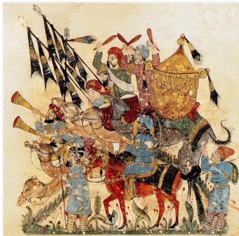
Caravane de pèlerins, manuscrit des Maqâmât d'Harîrî Schefer (1237 - enluminure sur papier).

L'expansion de l'empire arabe entre le 7e et le 8e siècle est souvent associée à la montée de l'islam et aux conquêtes menées par les premiers califes.